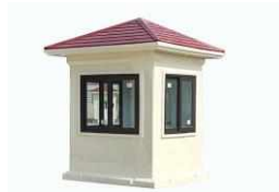
P. Bảo vệ